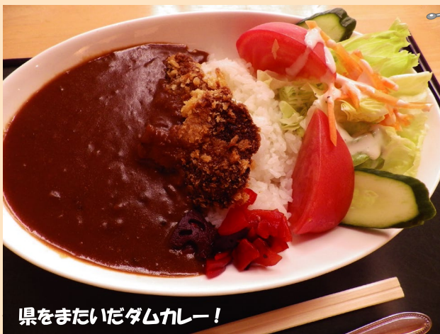
県をまたいだダムカレー!

御杖村の近くにある三重県名張市の「比奈知ダム」。ダム自体は三重県にありますが、水源が奈良県御杖村にあることから、県をまたいだダムカレーが実現しました。御杖村産のお米や鹿カツを使用し、御杖村の特徴も取り入れています。このようにコラボしたダムカレーは珍しいので、ぜひ一度食べてみてください!