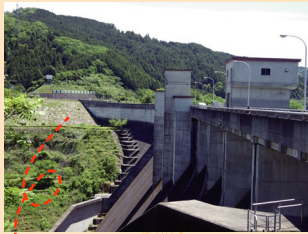
この部分がロックフィル (石積み)部分です