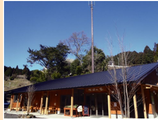
直売所兼カフェである布目の里では併設のパン工房から焼きたてのパンやスイーツが並びます