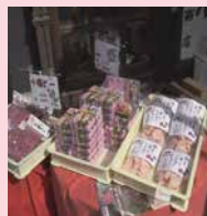
梅関連のお土産が揃う