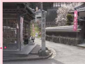
この石碑から観梅道スタート

マップは月ヶ瀬観光協会HPにあります https://tsukigase-kanko.or.jp/