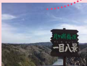
シャッターポイントがいっぱい！