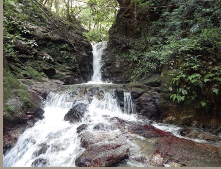
奈良市月ヶ瀬桃香野 ※入口から徒歩10分程度