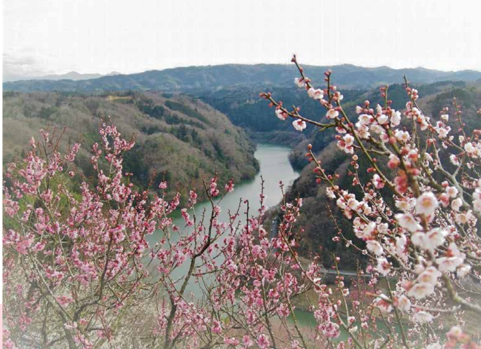
絶景スポット“一目八景”からの眺め