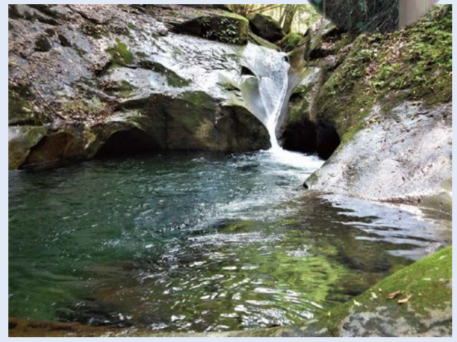
神秘的な景色に出会える秘境