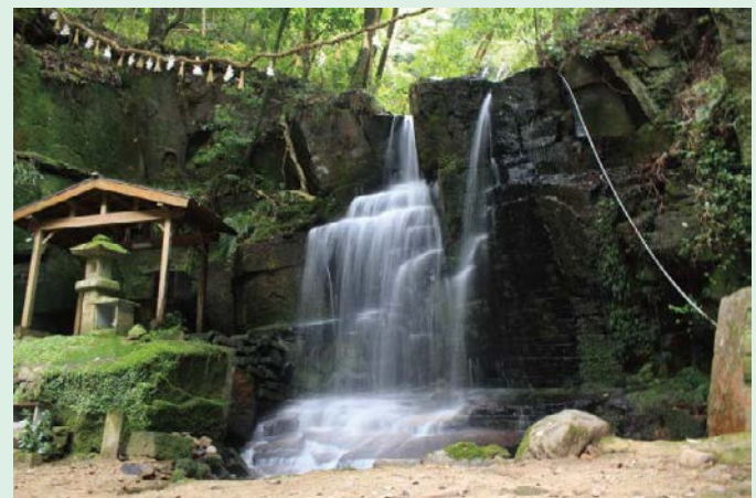
平家伝説ゆかりの滝!?

清澄な水と清々しい気が漂う神社への山道。龍が 鎮まると言う名に相応しい神秘的な場所です。