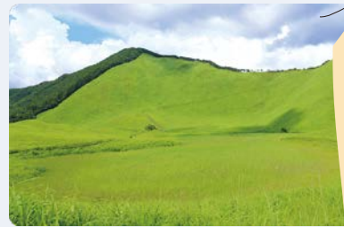
▲黄金のすすきだけでなく、緑の大草原も魅力