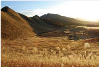
▲▶秋は金色に輝くススキの絶景が見られる