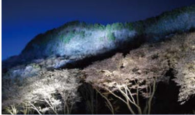
幻想的な屏風岩と山桜のライトアップ

併せてぜひ立ち寄りたいのが、屏風岩の麓にある「不退寺」です。ここには「源平しだれ桃」という八重咲の花桃の木があり一本の木に白花と紅花、紅白の絞りの3色が競い合って咲きます。源氏は白旗、平氏は赤旗を用いたところからこの名前が付いたといわれています。屏風岩公苑の桜と同時期に満開を迎えます。山桜とはまた違った艶やかな姿を楽しんでください。