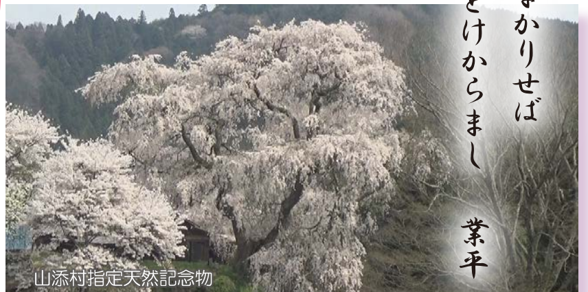
山添村指定天然記念物