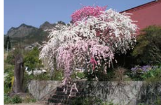
不退寺 曾爾村長野252

併せてぜひ立ち寄りたいのが、屏風岩の麓にある「不退寺」です。ここには「源平しだれ桃」という八重咲の花桃の木があり一本の木に白花と紅花、紅白の絞りの3色が競い合って咲きます。源氏は白旗、平氏は赤旗を用いたところからこの名前が付いたといわれています。屏風岩公苑の桜と同時期に満開を迎えます。山桜とはまた違った艶やかな姿を楽しんでください。