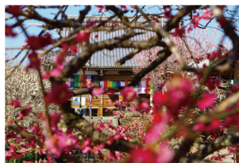
「梅林の寺」 松田 常義さんの作品