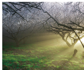
「朝日射す梅林」 宮川 和子さんの作品