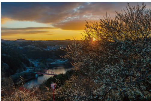
「夕焼け空に抱かれて」 渡邊 寛さんの作品