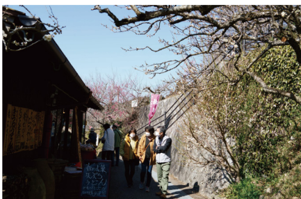
「昼飯時」 川邊 由紀典さんの作品