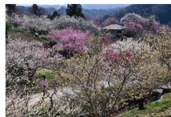
「春色様々」 竹本 晴行さんの作品