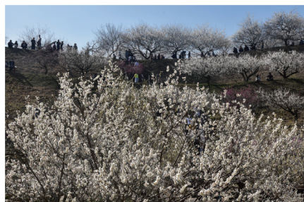
「春爛漫」 岡本 泰紀さんの作品