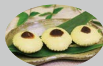
「いものかぶ焼酎ケーキ」

十津川番茶を使ったクッキー生地の子サブレで、餡をサンド。日本茶でもコーヒー・紅茶など何にでも合うお茶請け。温泉入浴前に血糖値が下がらないように！