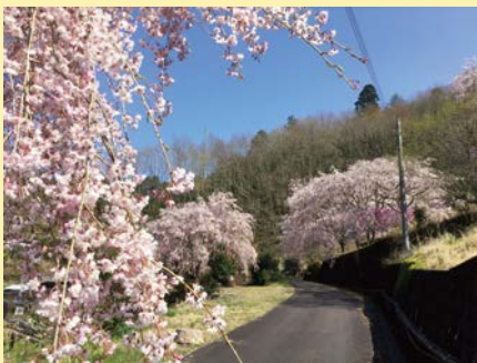
道路におおいかぶさるように咲くしだれ桜

十津川の山奥にある上湯温泉から、さらに和歌山の龍神温泉方面へ10キロほど先の小さな集落。そこには毎年、訪れた人を和ませてくれるしだれ桜の里があります。知る人ぞ知る桜の名所です。