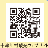
十津川村観光ウェブサイト