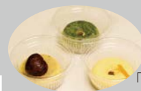
「生ドーナツ」 よもぎ・栗・柚子