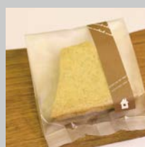
洋菓子協会長賞「おやまサブレ」

十津川産の日本酒の製造工程で生まれる酒粕を使った焼き菓子。風味は濃厚なチーズのようでもあり、甘じょっぱく、生地に全粒粉を使っているので食感もしっかり。