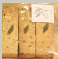
村長賞「ツツカワメイト」

昨年秋に開催された「第2回十津川村スイーツコンテスト」では、村の素材を活かしたお菓子作りが評価された2作品が入賞。十津川村で採れる農産物を使ったスイーツを発掘するのが目的のコンテストで、他のエントリー作品も含めた商品化が期待されています。温泉観光地、十津川村ならではの新たな名物やお土産の誕生が待ち遠しいですね！