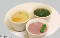
「プリン」 番茶・紫イモ・よもぎ