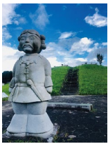
三隈葛古墳群 史跡公園

関西では自生が珍しいスズランですが、大和高原には二カ所のスズラン群落知られています。ひとつは奈良市都祁吐山。もうひとつは、宇陀市の室生にある向淵(むこうち)です。いずれも国の天然記念物に指定されています。気温などにより見頃の時期が前後しますが、だいたい5月下旬頃～6月初旬。店で売られているドイツスズランに比べ、この地に自生する日本原産のスズランは、花がひとまわり小さく優しい香り。葉に隠れひっそりとうつつむき加減に咲き、かがんで見る控えめな花です。マナーを守って鑑賞しましょう。