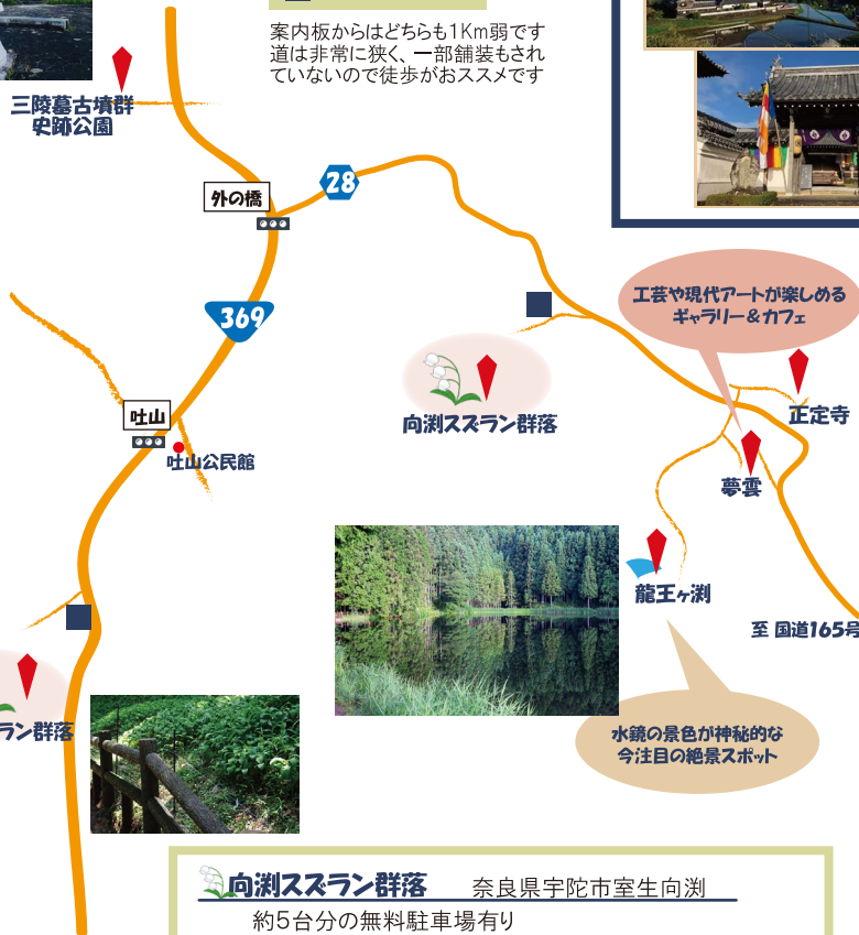
吐山スズラン群落

案内板からはどちらも1Km弱です 道は非常に狭く、一部舗装もされて いないので徒歩がおススメです