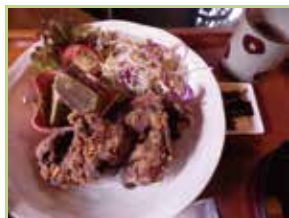
自家製味噌だれに漬けた鶏のからあげは、京都の老舗料亭仕込みのお吸い物とともに