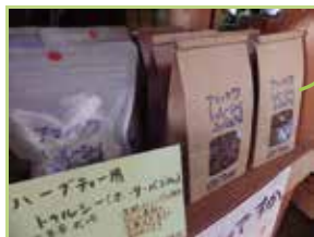
天川産のトウルシー(ホーリーバジル)は甘さと香りが格別