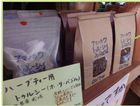
天川産のトウルシー(ホーリーバジル)は甘さと香りが格別