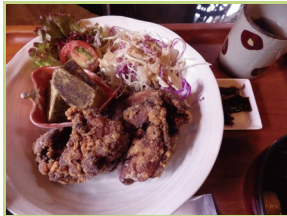
自家製味噌だれに漬けた鶏のからあげは、京都の老舗料亭仕込みのお吸い物とともに