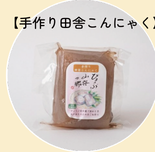
【手作り田舎こんにゃく】