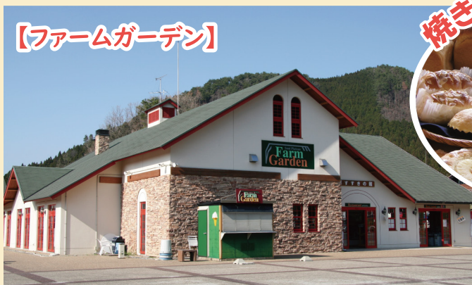
【ファームガーデン】