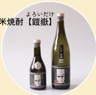
よろいだけ 本格米焼酎【鎧岳】