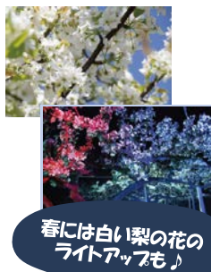
春には白い梨の花のライトアップも♪