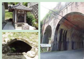
薬水の弘法井戸 レンガ造りの薬水高架橋(薬水門)