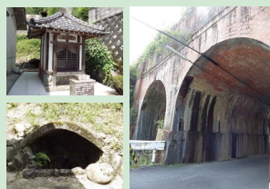
薬水の弘法井戸 レンガ造りの薬水高架橋(薬水門)