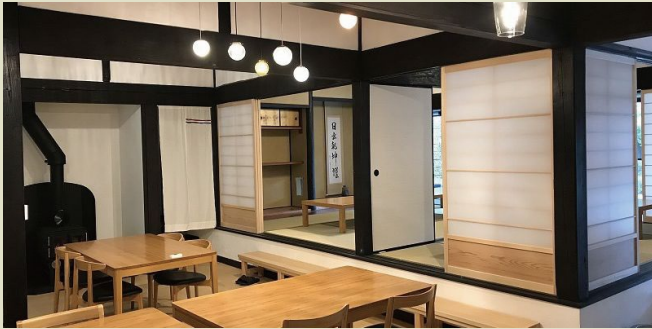
▲畳席・椅子席が選べます