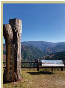
高野辻ビューポイント