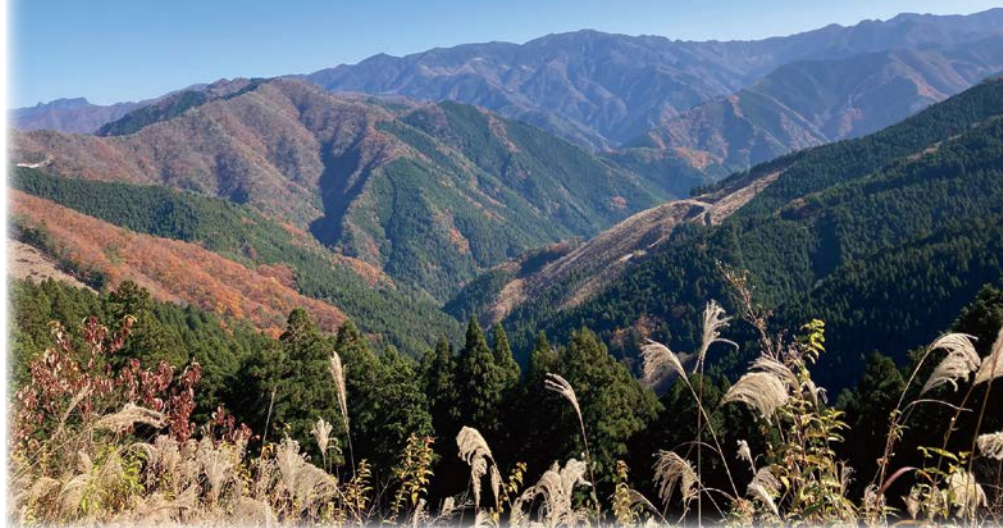
ヘリポートもある高野辻ビューポイントからの大パノラマ