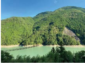
風屋貯水池が目の前の眺め