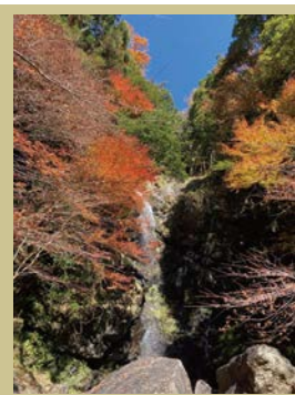
宮の滝 落差約40メートル 滝壺付近に虹が 浮かぶことも