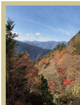
紅葉ライン 林道川津今西線約11キロ