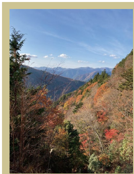
紅葉ライン 林道川津今西線約11キロ