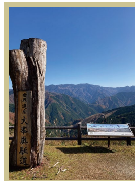
高野辻ビューポイント