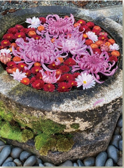
吉野山 如意輪寺 (2020年11月撮影)

神社やお寺の境内入り口付近にある手水舎。そこで参拝者がお参りする前に、手と口をすすいで身を清めることを「手水(ちょうず)を使う」といいます。昨今、柄杓などの共用を避ける為に手水を行えないところが多くみられますが、そんな中、手水鉢を花で飾って参拝者をお花で癒してくれる寺社が増えていきました。その寺社のお庭に咲く花や、会合やパーティーなどが中止になり廃棄される花が使用されます。本来、花手水とは手を清める際、水がない場合に草花で代用することを言いますが、数年前から京都府の楊谷寺(ようこくじ)が庭の花やもみじを定期的に手水鉢に添えたのが話題となり、花を浮かべた手水舎・手水鉢そのものを指すようになっていきました。それが徐々に全国へ広がり、今、さらに注目を集めています。吉野山の吉野神宮でも以前から、お花やもみじ、千羽鶴などを浮かべて手水舎を彩り参拝者の目を楽ませています。写真の花手水は同じく吉野山にある如意輪寺のもの。毎年11月には後醍醐天皇生誕を祝う菊が奉納展示されています。本堂後方の裏山には後醍醐天皇の京都への想いを表す「北面の御陵(北向きに埋葬)」があることでも知られる古刹です。μ