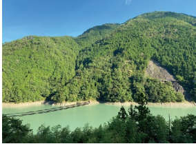
風屋貯水池が目の前の眺め