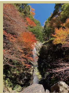
宮の滝 落差約40メートル 滝壺付近に虹が 浮かぶことも