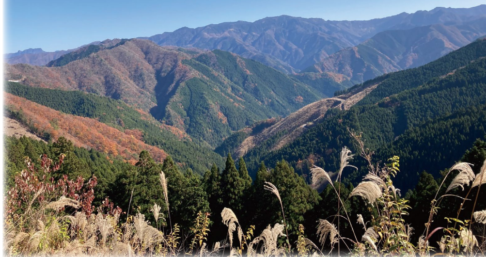
ヘリポートもある高野辻ビューポイントからの大パノラマ