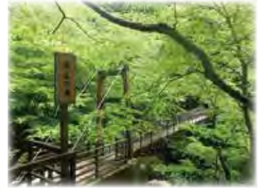
魚止の滝 (うおどめのたき)