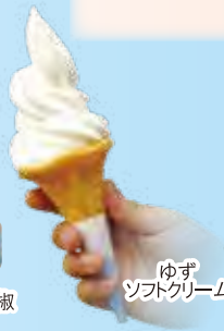
ゆず ソフトクリーム