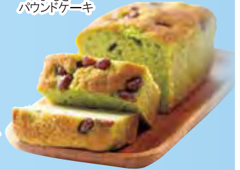
よもぎ パウンドケーキ