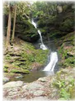
七滝八壺 (ななたきやば)

県道から100mほど静寂な道を進むと、落差およそ15mほどの滝が見えてきます。空海が靈感を受けて修行し、また天人が玉石を滝壺に投げ入れ、不動明王を礼拝したなど伝説が残る場所です。