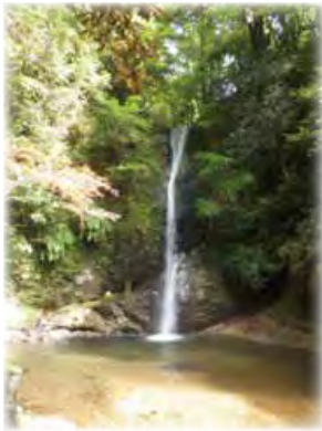
投石の滝 (なげのたき)