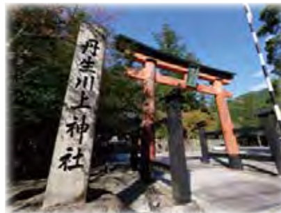
丹生川上神社 東吉野村小968

紀ノ川源流の最奥部である大又溪谷には、平成の名水百選・日本遺産に認定されている大小七つの段瀑である「七滝八壺」、さらに上流部には、魚がこの滝より上流に登れないという「魚止の滝」があります。