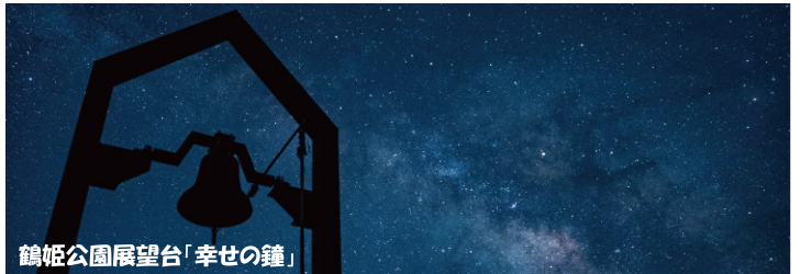
鶴姫公園展望台「幸せの鐘」