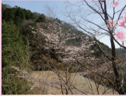
紀伊半島南部でしか見られない桜