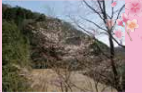
紀伊半島南部でしか見られない桜