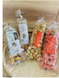
↑手作りおかし「きりこ」