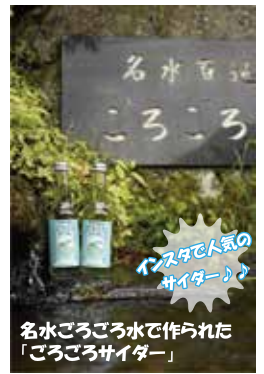
名水ごろごろ水で作られた「ごろごろサイダー」