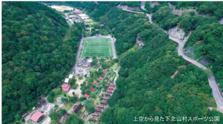
上空から見た下北山村スポーツ公園