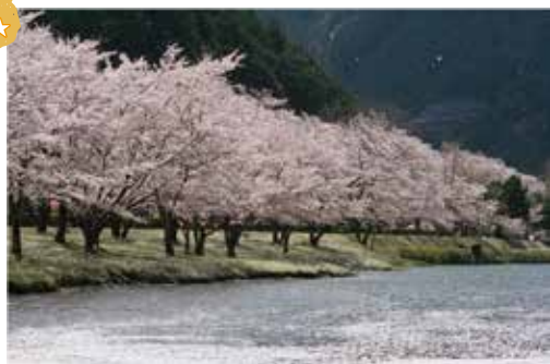
スポーツ公園の桜 (ソメイヨシノ)

■村の大部分が吉野熊野国立公園に指定されており、手つかずの自然が残る緑豊かな村です。村内には豊かな森に育まれた青く澄んだ川が、村民のくらしのすぐ近くを流れています。また海から近いこともあり、山と海両方の恵みを受けられる奈良県でも珍しい村です。