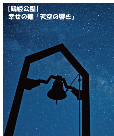
【鶴姫公園】 幸せの鐘「天空の響き」