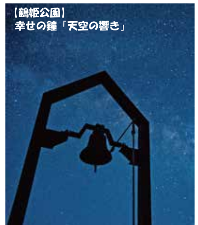
【鶴姫公園】 幸せの鐘「天空の響き」