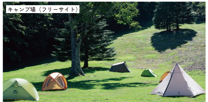
キャンプ場（フリーサイト）