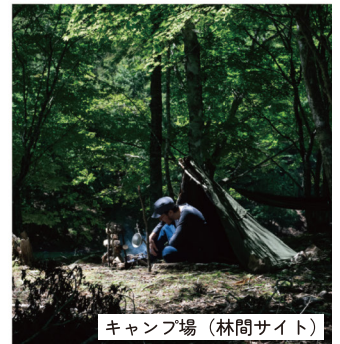
キャンプ場（林間サイト）