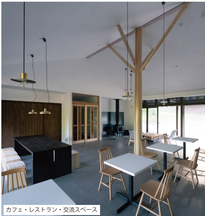
カフェ・レストラン・交流スペース

大和八木駅からバスで約2時間、和佐又山登山口バス停を下車、徒歩で約1時間20分。 ※大台ヶ原行バスは4月下旬～11月末ごろまでの運行。