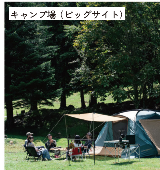
キャンプ場（ビッグサイト）