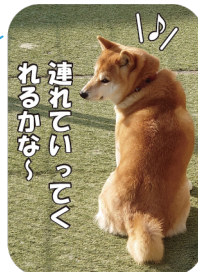
インナーテラス席はペット可