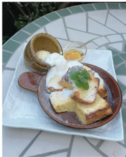
フレンチトースト