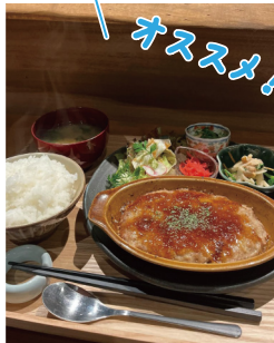
スプーンで食べる トロトロハンバーグ