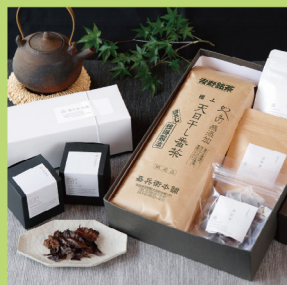
かへえ天日干し番茶

☎0746-32-2147 🏠大淀町中増1561 🕒9:00～17:00 📅土・日・祝・GW・夏期・冬期休暇